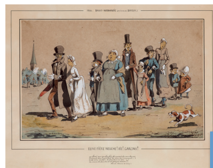
► Mariage en Basse-Normandie "Eune fière neuche ! Aie ! Garçons !", dessin original de Septime Le Pippre, 1866. Coll. MAHB. ©RMN-Grand Palais (Musée d'Art et d'Histoire Baron Gérard) / Thierry Ollivier

Un feuillet numérique consacré à Septime Le Pippre a été mis en place dans la salle Caillebotte (salle 12). L'intégralité de l'album ainsi que l'ensemble des autres dessins conservés par le musée y sont consultables, permettant au public d'accéder à tout moment à ces œuvres très fragiles.