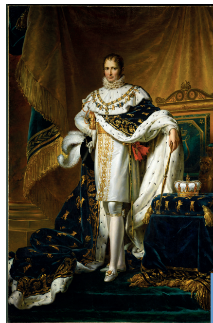
▲ Baron Gérard (atelier de) Portrait de Joseph Bonaparte 1809 - 1810 Huile sur toile, 244 x 162 cm inv. MNA 839.1.2

Exilé aux Etats-Unis et quelques temps à Londres à la fin de l'Empire, Joseph s'installe à Florence en 1839, année de la mort de sa fille Charlotte et de celle du cardinal Fesch, dont il devient l'héritier. A cause de difficultés juridiques concernant le legs Fesch envers la ville d'Ajaccio, il fait transformer le legs en donation Surveilliers, du nom qu'il avait pris en exil. Joseph ajoute au don de mille tableaux à la ville d'Ajaccio environ 500 autres qui seront répartis dans les villes et villages de Corse.