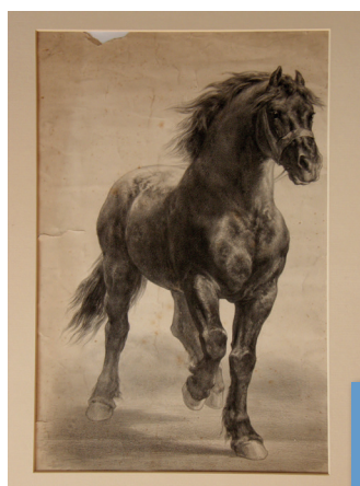
▲ Rosa Bonheur, Etudes pour le marché aux chevaux - Le Percheron

Le sanglier – Rosa Bonheur possédait dans son parc un sanglier nommé kiki. Très souvent, elle partait derrière la mare aux Fées, dans l'espace que lui avait donné (zone artistique) Napoléon III, la Gorge aux Loups où elle attendait l'arrivée des sangliers.