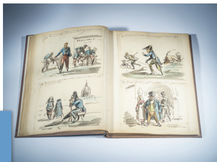
▲ Album de 130 dessins de Septime Le Pippre. Coll. MAHB.

PAR DOMINIQUE HÉROUARD, DIRECTRICE ADJOINTE DU MAHB