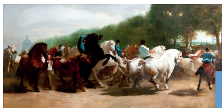
▲ Rosa Bonheur, Le marché aux chevaux (réplique)

Obtenir une place de premier plan dans l'art animalier en tant que femme au XIX e siècle était plus difficile que de réaliser des portraits ou des bouquets de fleurs. Il fallait un courage physique et psychologique certain pour fréquenter les abattoirs, habillée en homme, afin d'étudier les différentes morphologies de ses amis les bêtes. Elle fit preuve d'une puissance étonnante de travail dans ses œuvres de grand format où l'on découvre différentes races d'animaux :