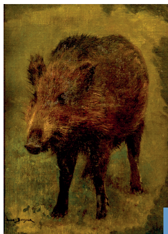
▲ Rosa Bonheur, Le Sanglier

Le Marché aux chevaux : réplique de l'œuvre exposée au Metropolitan Museum à New York. L'artiste joue sur la couleur des robes et la fougue des chevaux maîtrisés par des maquignons dans un mouvement tournoyant, ce qui confère au tableau un extraordinaire dynamisme.