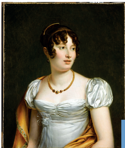
▲ Baron Gérard Portrait de Caroline Bonaparte, reine de Naples Vers 1812 Huile sur toile, 63 x 52 cm inv. MNA 839.1.10

Le palais Fesch conserve le plus grand ensemble des collections publiques françaises d'œuvres de cet artiste. Parmi celles-ci, il convient de souligner les représentations de Lucien Bonaparte et de son épouse Christine Boyer.