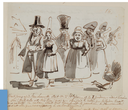
▲ Polydore et sa corneille (dessin n°16), extrait de l'album de 130 dessins de Septime Le Pippre. Coll. MAHB.

nombreuses similitudes entre des dessins volants connus et des dessins des albums.