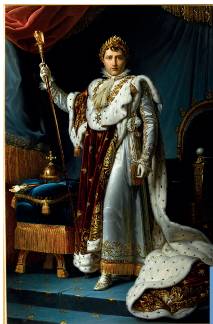
▲ Baron Gérard Portrait de Napoléon I er en costume de sacre 1805 - 1806 Huile sur toile, 223 x 144 cm inv. MNA 839.1.3

Il porte ici un manteau semé d'abeilles et doublé d'hermine, il arbore la Légion d'honneur, qu'il avait créée. Autour de lui se trouvent les regalia , les objets symboliques de la royauté : la main de Justice, utilisée par les rois de France depuis le XIII e siècle et le globe, symbole d'autorité depuis le Moyen Âge. Mais Napoléon tient aussi le sceptre surmonté de l'aigle impérial et sa tête porte la couronne de lauriers, empruntée aux empereurs romains.