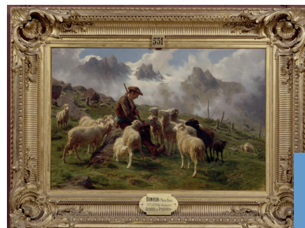
▲ Rosa Bonheur, Berger des Pyrénées donnant du sel à ses moutons

Le Percheron – Le percheron montre que l'artiste continue, jusqu'à sa mort, d'expérimenter les équidés qui demeurent pour elle une source d'inspiration, notamment la race percheronne représentée par sa rondeur, sa puissance et sa prestance. En 1883 a lieu la création de la Société Hippique Percheronne. En 1884, Rosa Bonheur peindra le premier champion de la race percheronne appelé Voltaire.