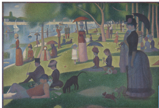
▲ Georges Seurat, Un Dimanche à la Grande Jatte , 1884 Huile sur toile, 207,5 x 308,1 cm, Art Institute of Chicago, ©Helen Birch Bartlett Memorial Collection

En 1886, il avait présenté, d'abord à la dernière exposition impressionniste puis à la deuxième exposition des Indépendants, un chef-d'œuvre innovant et ambi-