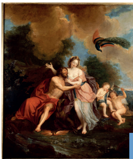
▲ COYPEL Antoine (1661 - Paris - 1722 - Paris), Jupiter et Junon sur le Mont Ida © Rennes, Musée des beaux-arts, photo de Jean-Manuel Salingue.

La Fédération va travailler à la réalisation de ces trois axes stratégiques au cours des prochaines années.