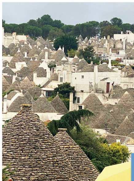
▲ Les trulli d'Alberollo

Cette région est aussi connue pour ces curieuses maisons à toit de pierre, les trulli. Ces habitations construites souvent en rond, en pierres sèches, sont coiffées d'un toit en pointe ou en dôme, constitué de plaques de calcaire à chaux montées progressivement comme des écailles de poissons. La petite ville d'Alberollo a conservé un ensemble de 11ha, regroupant plus de 1500 maisons, dont certaines, millénaires et classées au Patrimoine Mondial de l'Unesco, sont toujours habitées.