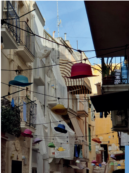
▲ Ruelle étroite et ombragée de Bari

Enfin ! Après trois reports (Covid, Ukraine,...) consécutifs, les voyageurs de l'AMBG sont enfin partis vers Bari, capitale de la région de Puglia (les Pouilles) le 17 octobre 2023, pour une semaine de découvertes.