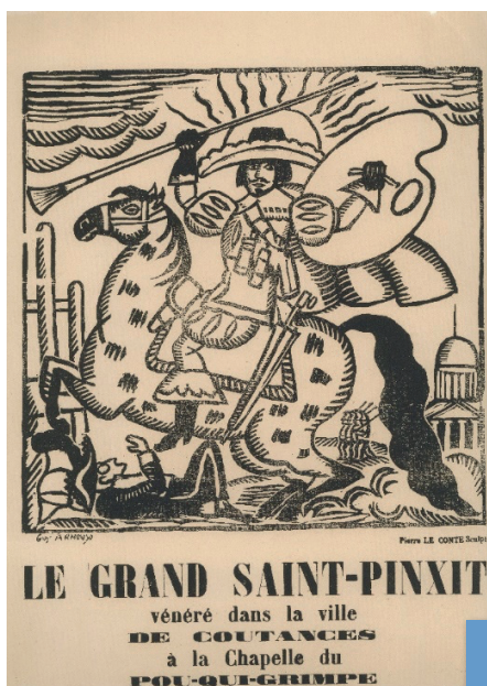
▲ ARNOUX Guy [dess.], LE CONTE Pierre [grav.], Le Grand Saint-Pinxit , début du XX e siècle Gravure sur bois, Musée Quesnel-Morinière