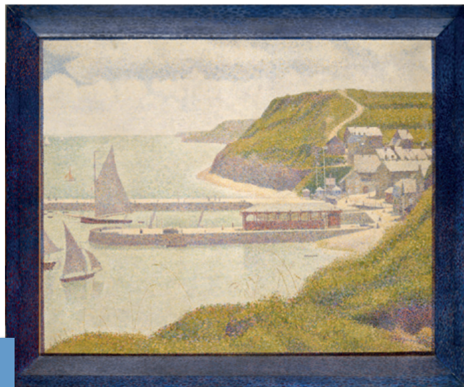
▲ Georges Seurat, Port-en-Bessin, avant-port, marée haute , 1888 Huile sur toile, 66 x 82 cm, Paris, Musée d'Orsay, Achat sur les fonds d'une donation anonyme canadienne, 1952

bassins intérieurs, le port, les quais, les falaises, la mer depuis les falaises et le village depuis les falaises. À la fin du XIX e siècle, Port-en-Bessin est un village d'un peu plus de 1000 habitants. Situé dans une anfractuosité de la côte du Calvados, à l'embou-