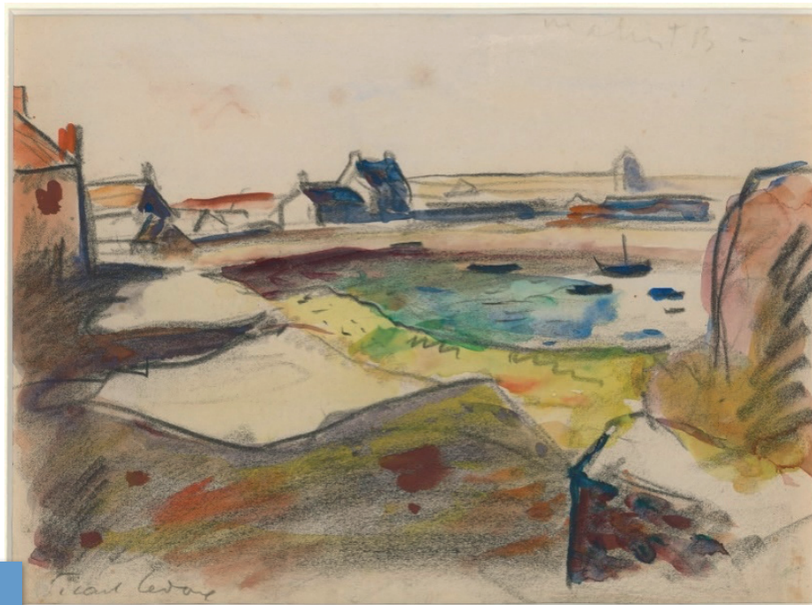
▲ PICART LE DOUX Charles, Ville portuaire , début du XX e siècle Pastel et aquarelle sur papier, Musée Quesnel-Morinière