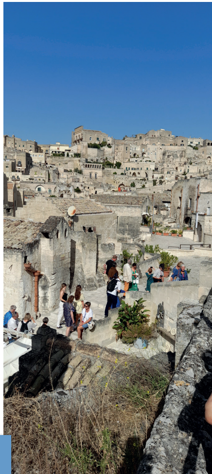
▲ Quartier ancien de Matera

En plus de ces édifices somptueux, les Pouilles offrent un patrimoine vernaculaire chaleureux. Il se décline à travers les quartiers et villes anciennes, parcourus par un entrelacs de rues étroites et ombragées, aboutissant à des petits ports baignés par la